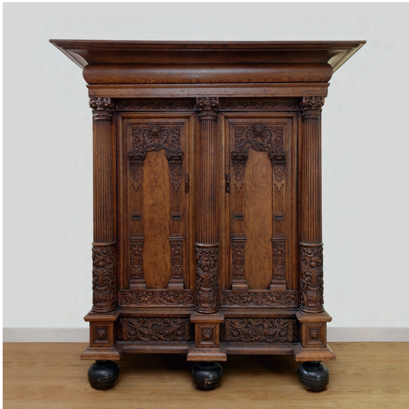
Schrank, Niederlande/Westfriesland, um 1650–1675