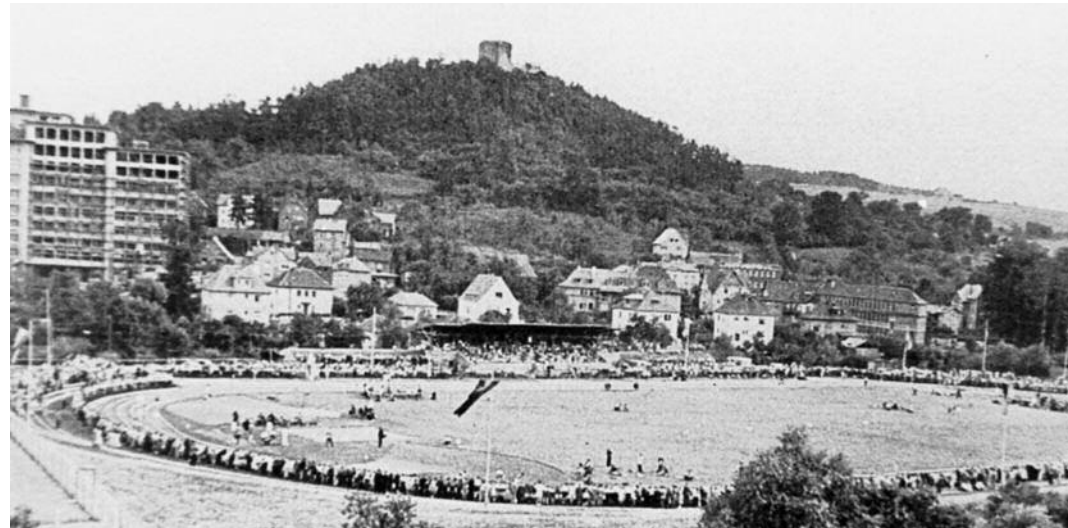
Wetzlarer Stadion, ca. 1950, Historisches Archiv der Stadt Wetzlar, T 5509

Der Sport war schon immer ein verbindendes Element für die Menschen. So verwundert es nicht, dass bereits drei Jahre nach Ende des Zweiten Weltkrieges, genauer am 10.10.1948 das Wetzlarer Stadion, wenn auch noch nicht ganz fertig, offiziell eröffnet und den Bürgern der Stadt Wetzlar zur Verfügung gestellt wurde. Fast genau 71 Jahre später widmet sich eine Sonderausstellung erstmals diesem Teilbereich der Wetzlarer Sportgeschichte. Gelegen auf der Lahninsel zwischen Lahn und Mühlgraben, westlich des Karl-Kellner-Rings nimmt es nicht nur als Ort des sportlichen Wettkampfes einen Mittelpunkt in der Stadt ein. Auch historisch ist der Platz interessant. So wurde der Platz des Stadions auch als